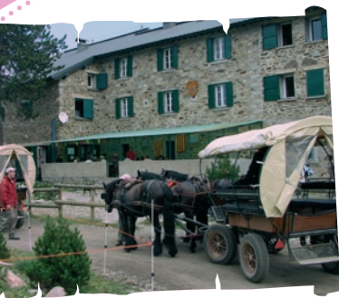
Les Cortalets, haut lieu du Canigó

Ils sont deux sur notre territoire : Le pôle Canigó piloté par le Pays Terres Romanes en partenariat avec le syndicat mixte Canigó grand site et le Pays Pyrénées Méditerranée et le pôle Pyrénées catalanes piloté par le Parc Naturel Régional des Pyrénées Catalanes. Organisés autour de thématiques touristiques fortes ou de sites d'accueil mettant en exergue des activités ou des produits identitaires du territoire (sports d'hiver, tourisme vert, tourisme patrimonial, thermalisme, thermo ludisme, randonnées...), ces pôles accompagnent les projets visant à diversifier l'offre touristique du territoire.