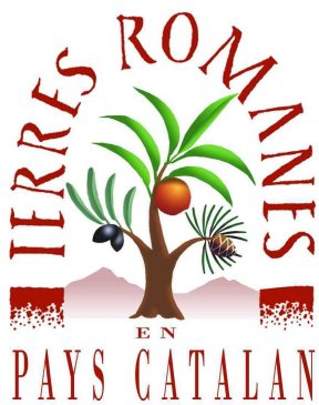
Schéma de développement culturel du Pays Terres Romanes en Pays Catalan